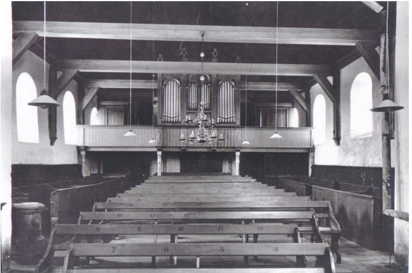
1953: Interieur kerk voor de restauratie - richting schip/toren

Jan vertelt verder over hoe de kerk er toen uitzag: