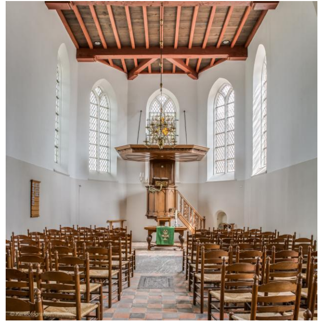
Interieur vanaf 2004