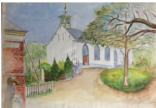
Aquarel van de kerk in Asch (Coll. M. Vermeulen)