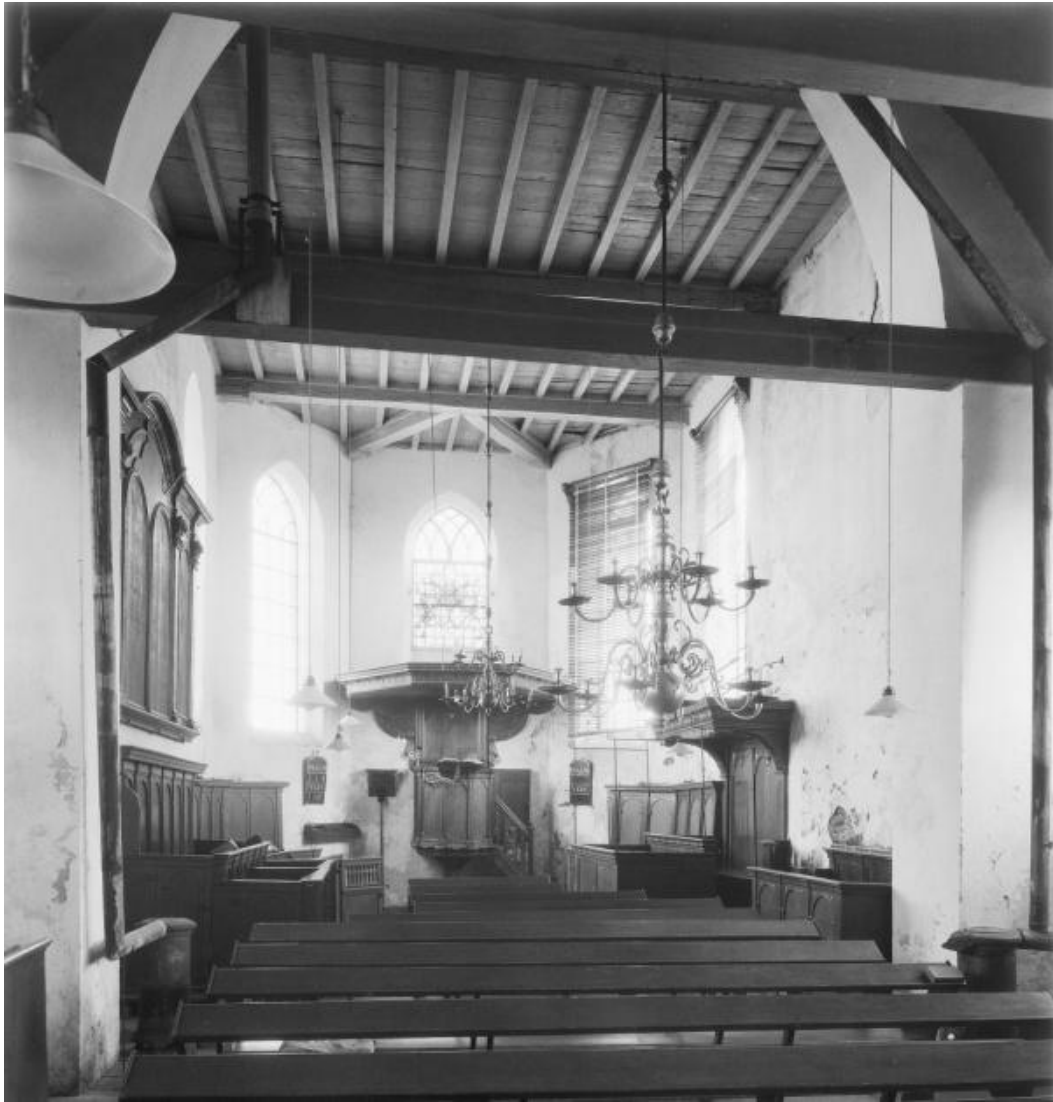
1953: Interieur kerk voor de restauratie - richting koor