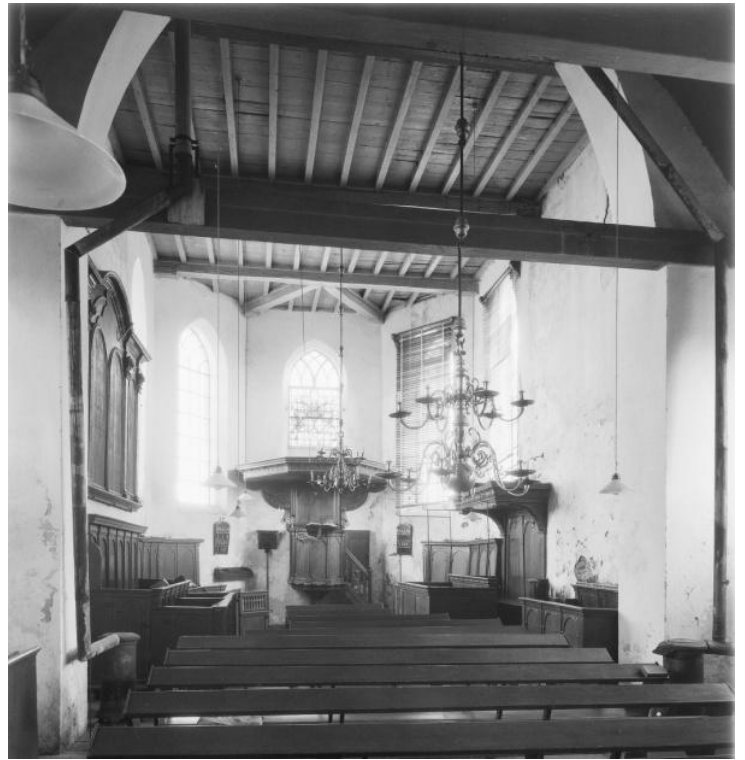
Het koor na en voor de restauratie van 1954