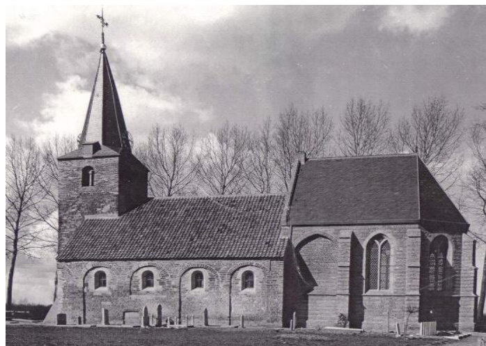
De kerk voor en na de restauratie