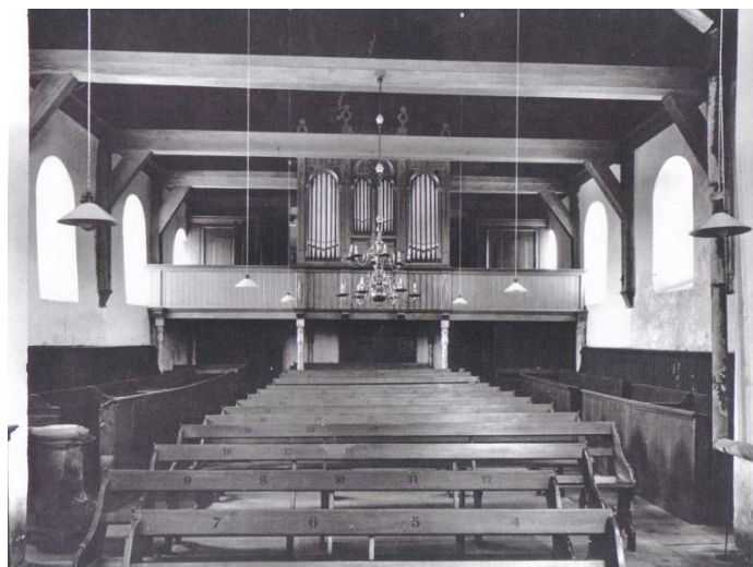
Het schip van de kerk na en voor de restauratie van 1954

Bij de heropening van hun kerk, zullen de inwoners van Wadenoijen van de veranderingen versteld hebben gestaan. Van buiten prachtig gerestaureerd en als vanouds weer een pareltje aan de Linge! Al zal de binnenkant, hoe mooi ook, voor velen ook wel even wennen geweest zijn.