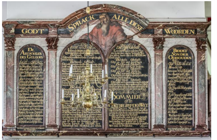
Het gebedenbord voor en na de restauratie