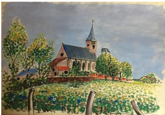
Aquarel van de kerk in Erichem