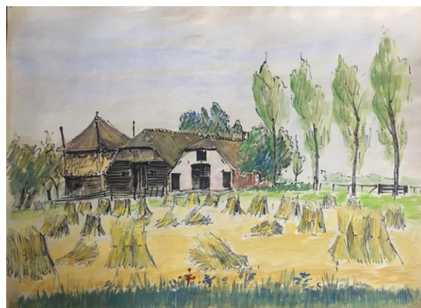
Aquarel van een onbekende Betuwse boerderij (Coll. M. Vermeulen)

Vooraf oude kerken bleven Maarten zijn hele leven lang fascineren. Na zijn pensionering stortte hij zich dan ook volledig op zijn grote passie: de bouwhistorie van een 15-tal dorpskerken in de omgeving. Het was de bedoeling om alles wat hij daarover in een manuscript had vastgelegd ook in boekvorm uit te geven, maar daar is het helaas nooit van gekomen.